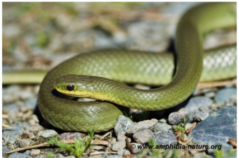
Une couleuvre verte dans son habitat.

Vous pouvez signaler vos observations à Amphibia-Nature qui confirmera l'identification de l'espèce et pourra répondre à vos questions. Tout signalement, récent ou passé, est pertinent s'il est accompagné d'une photo, d'une date et d'un lieu d'observation. Ces données permettront d'accroître nos connaissances sur la répartition des espèces et seront utiles à des fins de conservation des habitats et de sensibilisation du public.