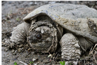
Une tortue serpentine sur le bord d'une route.