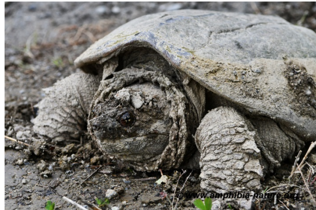
Une tortue serpentine sur le bord d'une route.