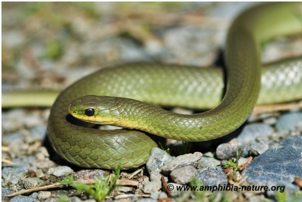
Une couleuvre verte dans son habitat.

Vous pouvez signaler vos observations à Amphibia-Nature qui confirmera l'identification de l'espèce et pourra répondre à vos questions. Tout signalement, récent ou passé, est pertinent s'il est accompagné d'une photo, d'une date et d'un lieu d'observation. Ces données permettront d'accroître nos connaissances sur la répartition des espèces et seront utiles à des fins de conservation des habitats et de sensibilisation du public.