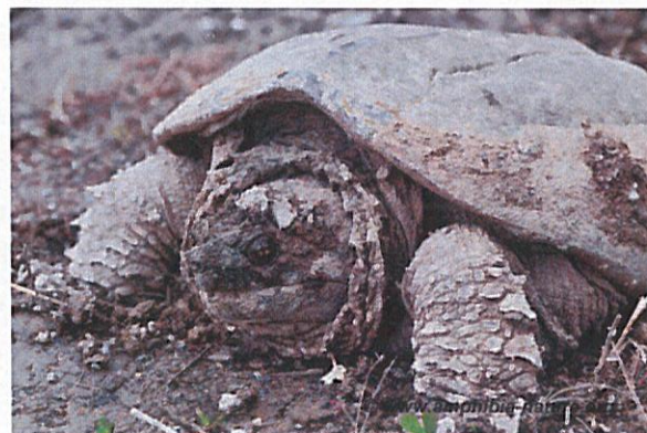
Une tortue serpentine sur le bord d'une route.