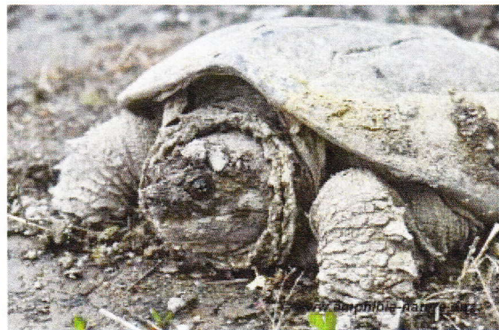
Une tortue serpentine sur le bord d'une route.